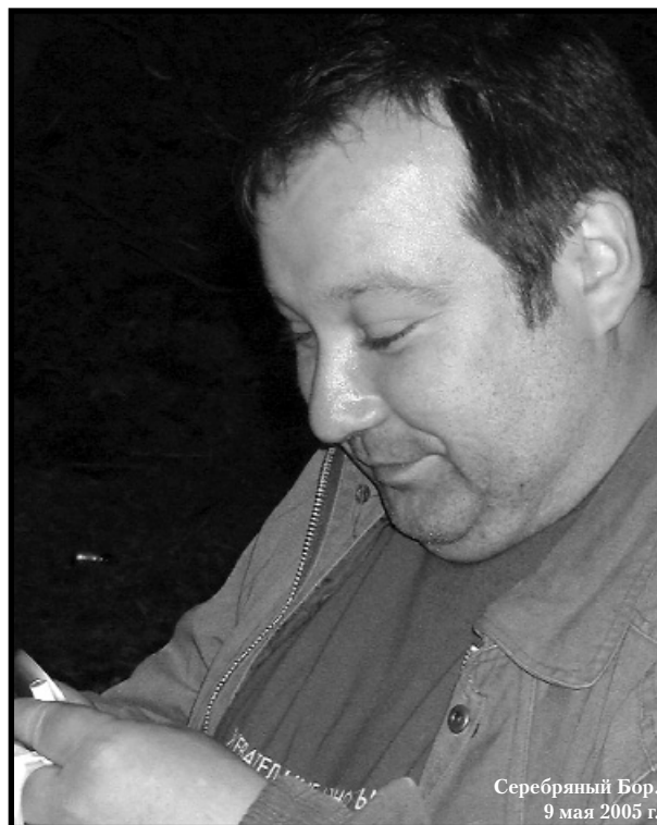
Серебряный Бор, 9 мая 2005 г.

Но всегда приходит время полнолуния и звёзд, когда вредные сомнения опускаются под лёд. И тогда, всё может случиться, ты увидишь свет в ночи, и захочешь в нём остаться, отыскать к себе ключи, к судьбе ключи, к душе ключи.