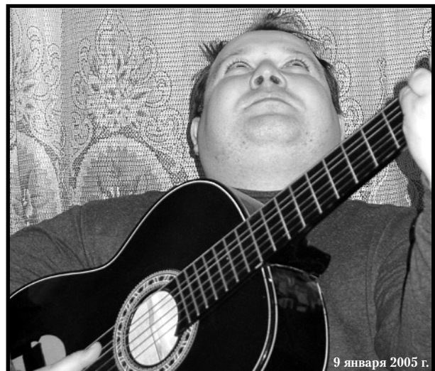
9 января 2005 г.

Пройти по темным аллеям, по центру столицы древней И чувствовать, не старея, и жизнь, и землю, и небо. Пройти по темным аллеям, по центру столицы древней И чувствовать, что не стареют ни жизнь, ни земля, ни небо.